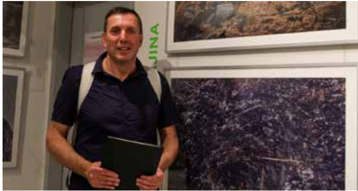
Butovice), od 12. 9. bude výstava putovat po Česku. V příštím vydání přineseme s fotografem Jiříem Souralem rozhovor.

přírody a je rozdělena do šesti hlavních kategorií. Nominované snímky vybírala odborná porota z více než 2 400 fotografií. Do soutěže své práce poslalo 254 fotografů z České a Slovenské republiky. Hlavním cílem soutěže a následné výstavy vítězů, nominovaných a dalších vybraných fotografií je vzdělávat veřejnost a motivovat ji k péči o přírodu. Výstavu je možno zhlédnout do 3. 9. v galerii Czech Photo Centre, Seydlerova 2835/4, Praha 5 (Nové