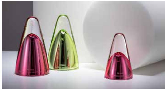
Festivalové ceny z dílny výtvarníka Františka Jungvirta

Z vokálně instrumentálního souboru Gymnázia Jiřího z Poděbrad Collegium 2010 jsme vybrali studenty, kteří v Lucembursku opět v roce 2023 velmi úspěšně reprezentovali Českou republiku v rámci programu EU Erasmus+ Youth in action. Jedná se o multilaterální projekt pro 60 mladých lidí z 10 zemí Evropy. Naším mladým hudebníkům s nezbytnými zkušenostmi s prací v orchestru a pěveckém sboru připravujeme jedinečnou příležitost prožít neopakovatelných deset červencových dní s kolegy muzikanty z celé Evropy. Důležitým cílem projektu je kromě intenzivní práce v mezinárodním orchestru a pěveckém sboru se mj. zdokonalit v cizích jazycích, mít možnost najít nové přátelé napříč Evropou a ověřit si