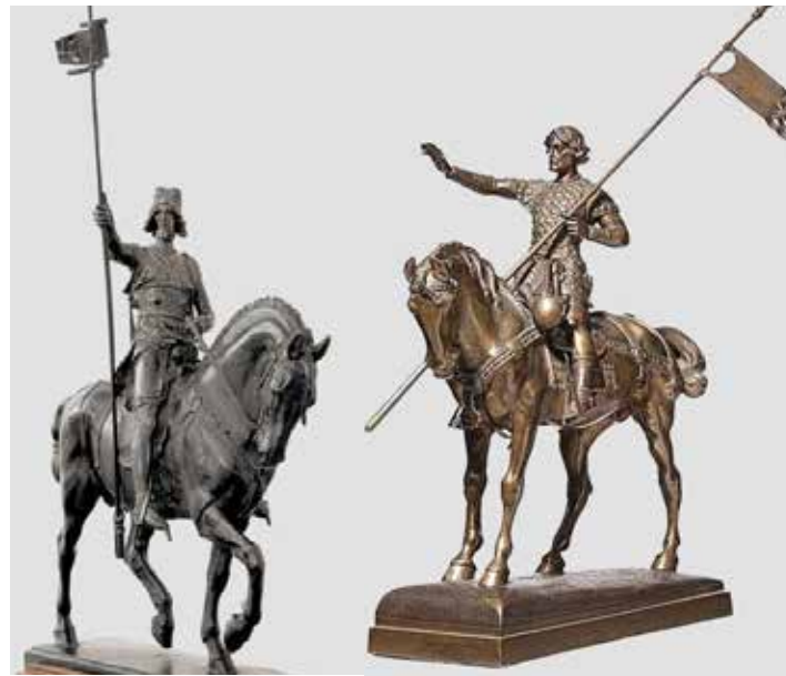
Původní modely soch sv. Václava od J. V. Myslbeka (vlevo) a B. Schnircha

Schnirch se v druhé polovině 80. let stává vyhledávaným módním sochařem. Stojí na vrcholu umělecké slávy. Většina veřejných pražských budov se pyšní jeho plastikami a ornamenty, ale stále mu schází opravdu monumentální dílo. A tak si vzpomene na svůj dávný slib. První impuls už vyšel od poděbradských sokolů, kteří 15. dubna 1883 založili Spolek pro zbudování pomníku králi Jiřímu v Poděbradech. Schnirch situaci bedlivě vnímá, protože nikdy neztratil kontakt s rodným městem své matky. Dokonce se