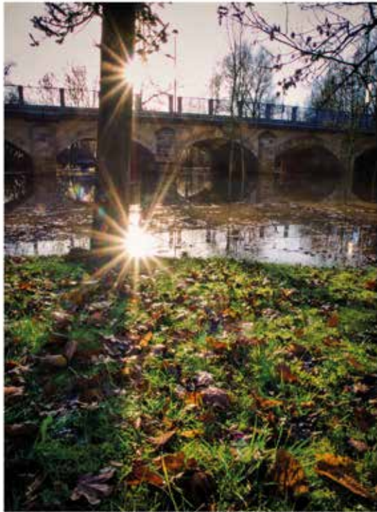
2. ledna - zaplavené okolí kostelíka

Tedy přesněji řečeno, všude kolem Havířského kostelíku Na Zámostí. Pan fotograf Petr Bacílek redakci poskytl krásný snímek nazvaný Krasobruslení u kostelíčka, který umístil jedenáctého ledna na facebookové stránce Máme rádi Poděbrady. A právě kolem tohoto dne voda, která se s pováňací povodní rozlila po celém Zámostí, pod vlivem nízkých teplot zmrzla a vytvořila obří kluzišť. To v následujících dnech navštívily stovky malých i velkých bruslařů a na ledu vytvořily kouzelné obrazce. První snímek prozářený paprsky slunce dokládá stav daného místa bezprostředně po Novém roce, kdy teplota šplhala k deseti stupňům. Za pár dnů bylo všechno jinak... (mol)