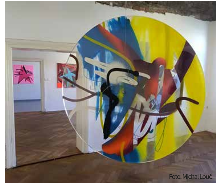
Výstava Afinita (r. 2020).

Pozn. red.: Pop up galerie bývají umělecké prostory vytvořené z prázdných nevyužitých objektů, které vznikají dočasně.