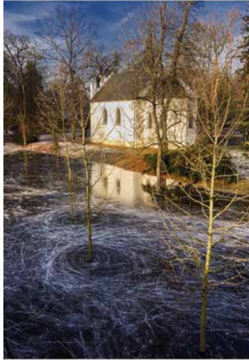
o 9 dní později...