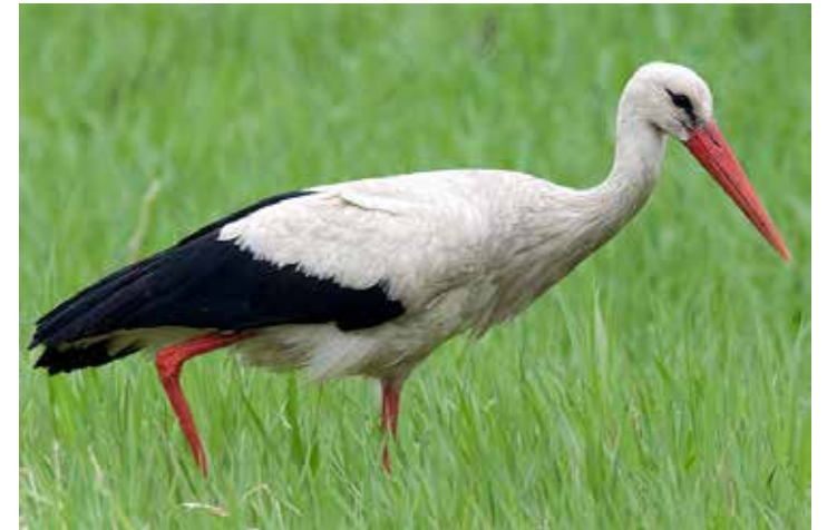
Čáp bílý je ozdobou polabské krajiny, vytvořme pro něj odpovídající podmínky.

Bylo by škoda, kdyby čápi z Polabí vymizeli. Vždyť nosí děti... Tato pověra se vyskytuje v mnoha evropských zemích. Původ má ve starogermánské báji, kde čáp byl poslem bájných postav, paní Zimy (Frau Holle). Čáp na její pokyn lovil z vody rybníku duše ještě nenarozených dětí a vkládal je do těla matek. Kdyby to přece jen byla pravda, chraňme přírodní prostředí, ať se u nás čápům líbí a je jim tu co nejlépe.