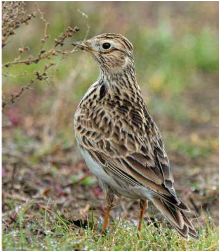
Skřivan polní je nejen posel jara, ale i symbol naděje a nových začátků.

Již na začátku března se objevuje skřivan polní. Je však běžné, že někteří jedinci přiletí už v únoru. Platí to odpradáвна, je to zaznamenáno i v přísloví „v únoru, když skřivan zpívá, velká zima potom bývá“. Je smutné, že i skřivana, typického a hojného zástupce polních ptáků, budeme brzo zařazovat mezi ohrožené druhy. Podle výsledku Jednotného programu sčítání ptáků se stav skřivanů od roku 1982 do roku 2022 snížil o 60 %. Poděbrady a okolí nejsou výjimkou. Skřivan je k vidění hlavně na travnatých plochách, na loukách, pastvinách a polích. Je nenápadný pták, trochu větší než vrabec. Až uvidíte nějakého ptáčka, který se třepotá ve výšce až 100 metrů nad travnatou plochou, a přitom jasně a melodicky trylkuje,