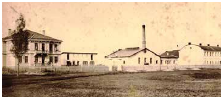
Celkový pohled na areál sklárny v roce 1876.