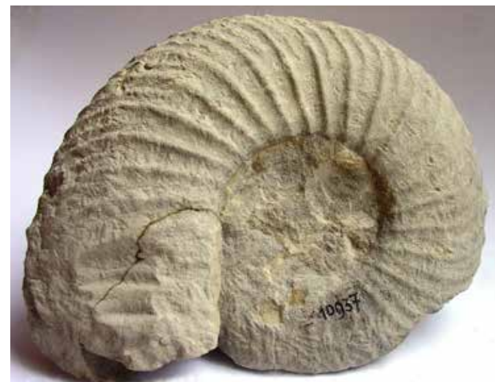
Ve sbírkách Polabského muzea v Poděbradech se nachází mnoho vynikajících nálezů amonitů z Polabí: Pachydiscus cf levyi od bývalého rybníka Blato.

Pohybovali se pomalu principem zpětného odrazu za pomoci vyprazdňování plynu a vody. Po pádu meteoritu, kdy nastal v živočišné říši celosvětový hlad, se však stali kořistí pro dravější živočichy. To platilo také pro jejich plod vznášející se u hladiny, který náhlou změnu teplot a toxické prostředí po pádu planetky nemohl přežít. Příbuzní z hlubších vod, zmíněné loděnky, a také další příbuzní amonitů z třídy hlavonožců, jako jsou chobotnice, olihně a sépie, na tom byli lépe a dokázali v hlubších vodách přežít.