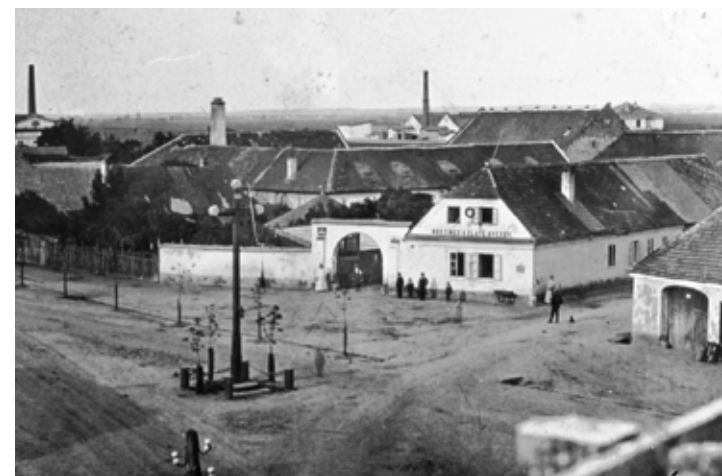
Pohled ze střechy školy (dnešní hotelovky) k severovýchodu, kde je vidět umístění sklárny v polích krátce po dokončení.